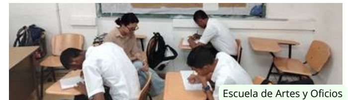
Escuela de Artes y Oficios